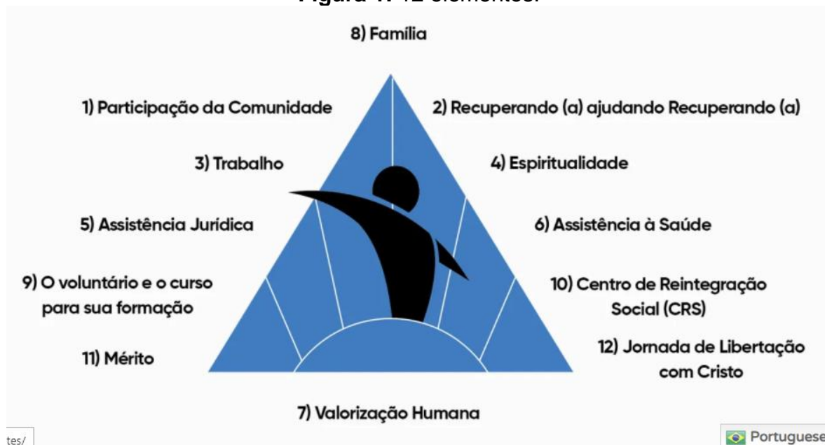
Figura 1: 12 elementos:

O método APAC é baseado em 12 elementos essenciais que foram surgindo após anos de pesquisas, buscando alcançar índices de excelência, e foi se tornando uma presença impactante e transformadora na sociedade onde está inserida.